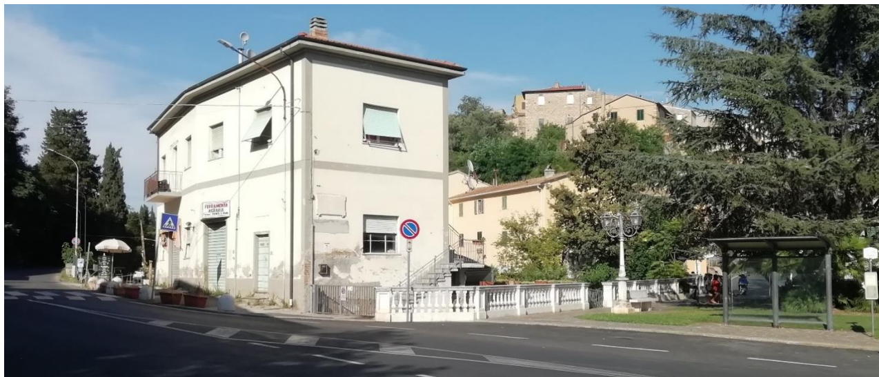
Figura 4 – L'edificio che sorge sull'antico Mulino della Madonna. L'epigrafe è visibile sulla sinistra della parete rivolta verso sud. A destra l'area verde che potrebbe essere quella desinata a diventare Largo Pietro Gori con la delibera N. 114

La cartolina riprodotta in Figura 5, ben nota ai bibbonesi, ci mostra come l'edificio su cui si trova oggi l'epigrafe sia stato costruito sui resti del preesistente "mulino elettrico Gardini" forse riutilizzando parti delle murature. La fotografia potrebbe essere stata scattata negli anni '30 dello scorso secolo ovvero in pieno periodo fascista come indicato anche dalle scritte sul muro: "W il fascio" e "[W] Ciano". Infatti nel 1930 l'Annuario Toscano 16 censisce un mulino attivo a Bibbona il "Molino elettrico Gardini - Barabino E.". Il mulino elettrico non era altro che l'evoluzione dell'antico mulino ad acqua, il Mulino della Madonna che sorgeva nello stesso luogo 17 . Chiaramente l'avvento della elettricità, che a Bibbona arrivò nel settembre del 1924, aveva reso inefficienti gli obsoleti mulini a vento ed a acqua. Sull'edificio non c'è ancora traccia della epigrafe.